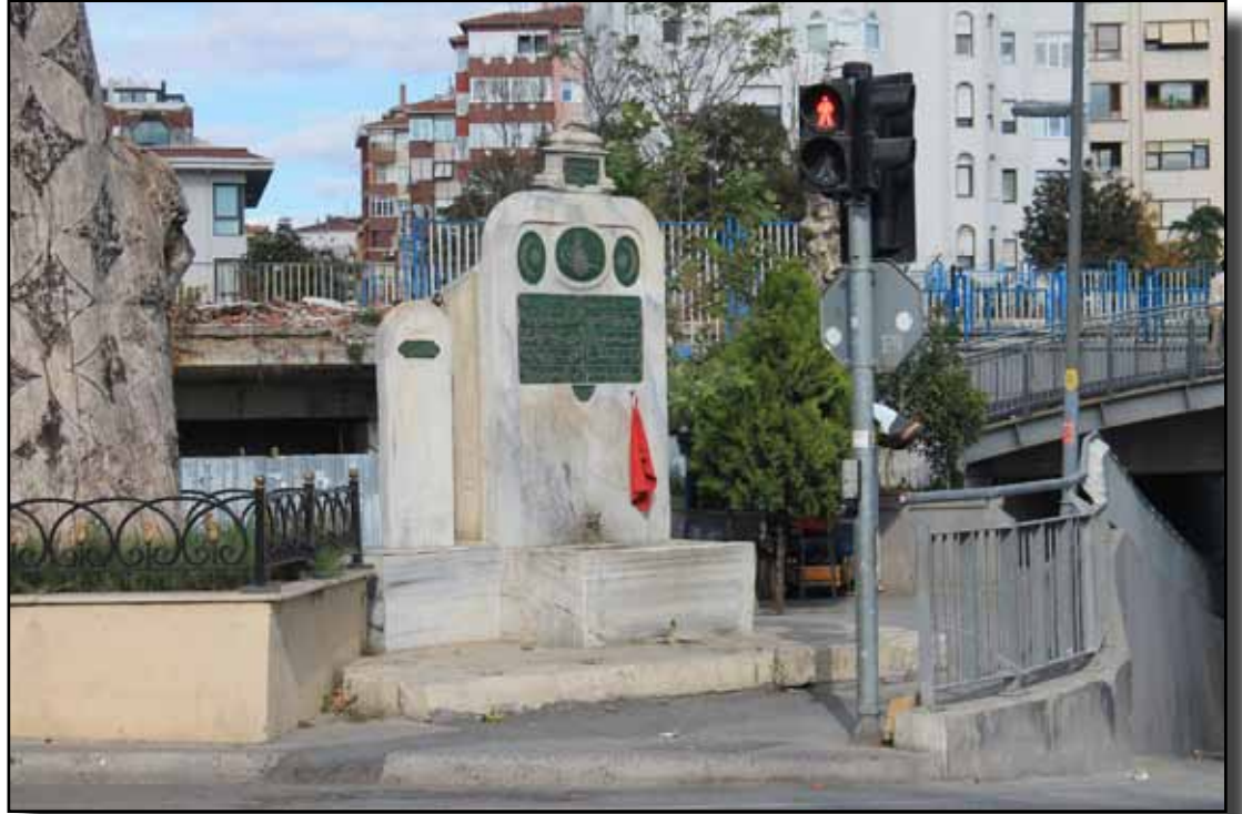
Bostancı köprüsü ve Bostancı (Derbent) Namazgâhı.

Bostancı: Bostancı'da bir kârgir karakol ve akan bir çeşme ve karakolun bitişiğinde bir namazgâh vardır. Burada Kayış Dağı yönünden gelen, yani kuzeyden güneye doğru olan ve bahar mevsiminde akan bir dere üzerinde küçük kârgir bir köprü vardır. Bu köprü, Üsküdar'dan Bağdat'a kadar giden en büyük Anadolu Caddesi için inşâ olunmuş ve bir zamanlar bu yerde yolcuların tezkeresi sorulup yoklanmaktaymış. Bu köprüye Bostancı Köprüsü ve caddeye de Bağdat Caddesi denilir. Eskiden Bostancı tarafındaki sebze bahçelerinde bahçıvanlık yapılırdı. Osmanlı devrinde Bostancı, İstanbul'un giriş kapısıymış. Eskiden burada bir karakol bulunmuş ve İstanbul'a Anadolu'dan gelenlerin İstanbul'da herhangi bir iş-