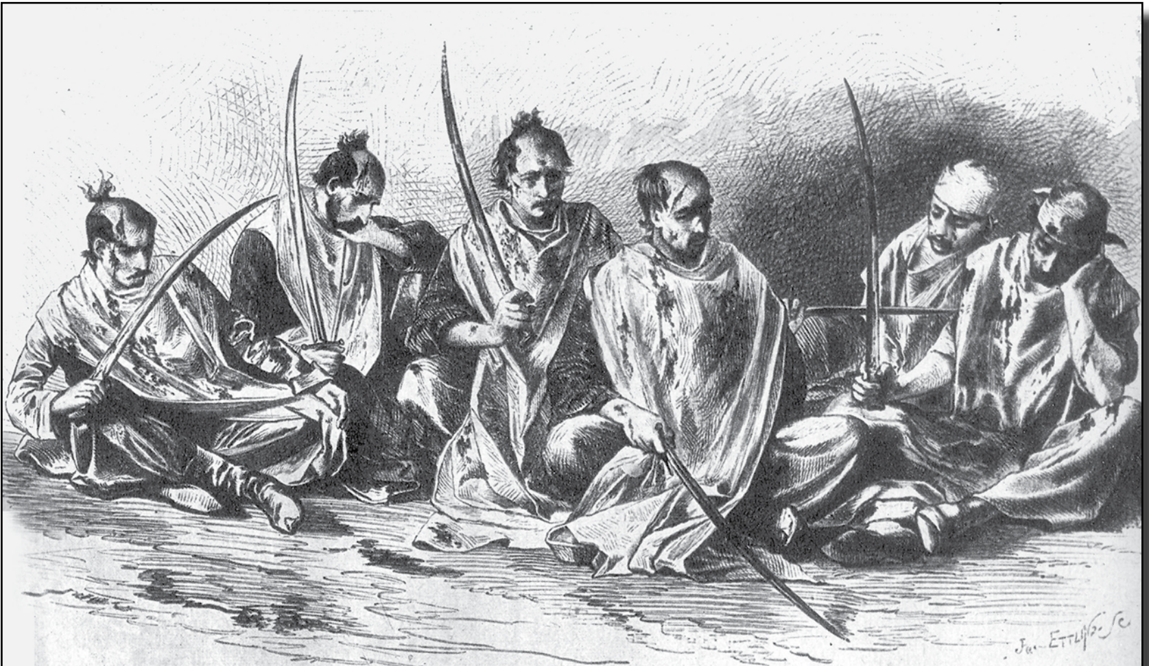
Kerbela olayının matemini tutan Şiiler'in kılıçlarla kendilerini dövmeleri.

Çadıra kapalı, heyecan ve ıstıraptan bitmiş kadınlarla, o zaman pek küçük bir çocuk olan Hüseyin'in oğlu Ali'nin ise, belge değerinde, bilgi verecek güçleri zaten olamazdı. Bu yüzden, olayın çok zenginleştirilmiş efsane bölümlerinin sağlığı üzerinde daima ihtiyatla durmak yerinde olacaktır. Ne var ki, Hazret-i Hamza nasıl bir «serdâr-ı şehîdân» ise Hazret-i Hüseyin de öylece bir «Şâh-ı şehîdân» dir.