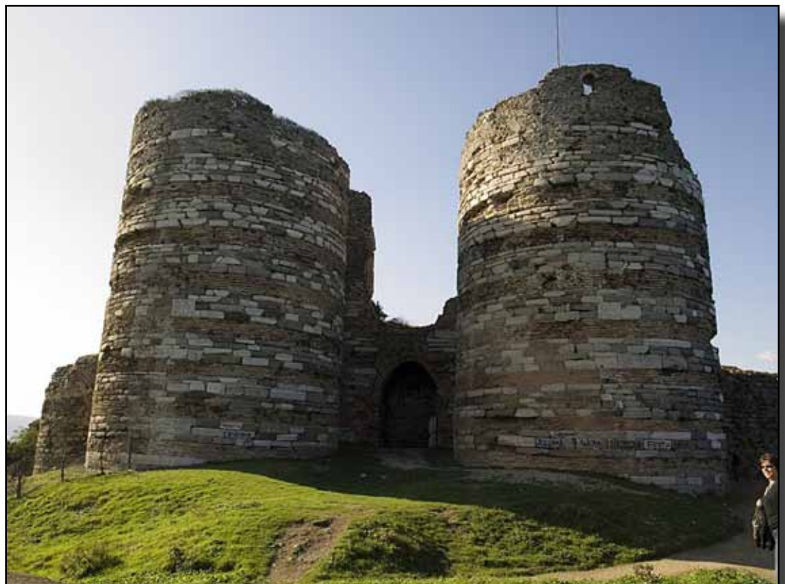
Ceneviz Kalesi (Yoros).