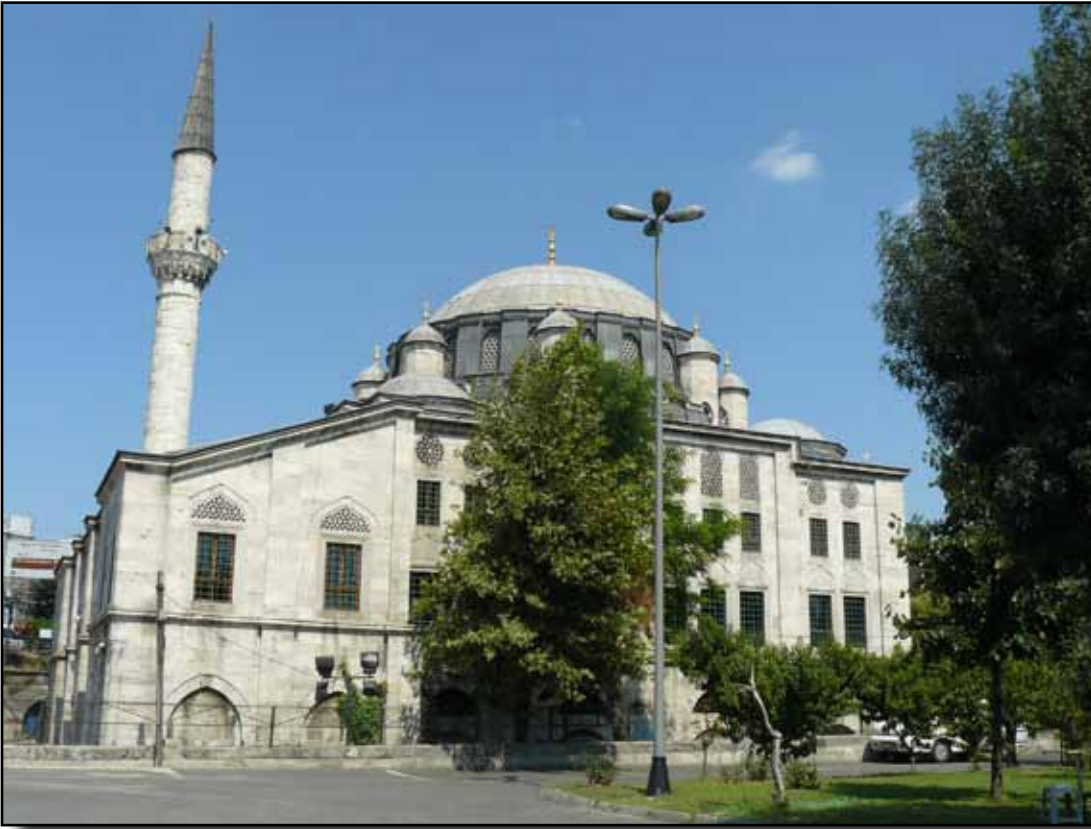
Azap Kapısı Camii.

pısı, ve zamanla değişerek Azap Kapısı adı verilmişti.