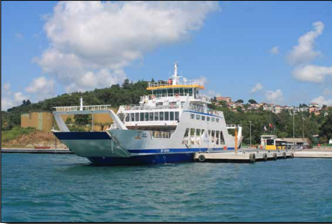
Çubuklu araba vapuru iskelesi.

mış Cömert huylu vezir İbrahim Deniz köpüğü gibi lütuflarına alışılmış Çünkü bahar bulutu gibi lutfundan Bu yeni yapılan bahçe ile tazelandı Cömertlik ve ihsanı ile suya doydu Alemde bahçesinde kullar azat oldu Himmet etti Çubuklu'ya yani Yaptırdı doğası saf, temiz kaynağı Ne güzel, benzersiz eğlence yeri İmrenilen yeni şenlenen yerin açılışı Şimdi yine bir havuz yaptı O mesirenin güzelliği çoğalsın Havuz ama kızıl deniz gibi Havuz ama ırmağın göleti gibi Bir gün o yüce dağın tepesinden Geldi mutlulukla o savaş kahramanı gibi Seyrine bakıp mutlulukla Baş havuz olunca ana özelliği Dedi o kararsızın başına kul En mübarek feyizden uğurlu sayılıp Bundan sonra bu temiz mesirenin Cihanda adı feyz-âbâd (43) olsun Böbürlenerek tacını aldı keyfinden Yılları sayarak tarihini işledim Oldu gerçekten Allah için tarih Gönül çeken yer feyz-âbâd (43 makamı oldu