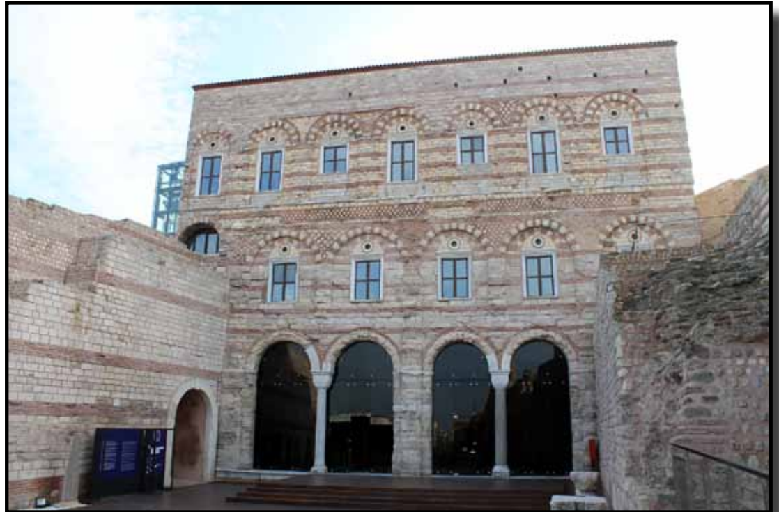
«Çerhapili (Çerhapyle)» kapısının ve Tekfur Sarayı'nın ön tarafından görünüşü.

İçinde duvarların kenarlarında kalan dişlerden ve pencerelerden bu yapının üç kat olduğu anlaşılmaktadır. Zemin katı iki sıra sütunlar üstüne örülmüş kemerlerle örtülmüştü. Avlu tarafından girilen kısımda yani kuzey tarafında dört köşe bir ayakla ayrılmış iki kısım olup her bir kısım ikişer kemerden oluşmuştur. Bu kemerleri tutan sütunlar gözenekli taşlardan olduğundan geçen