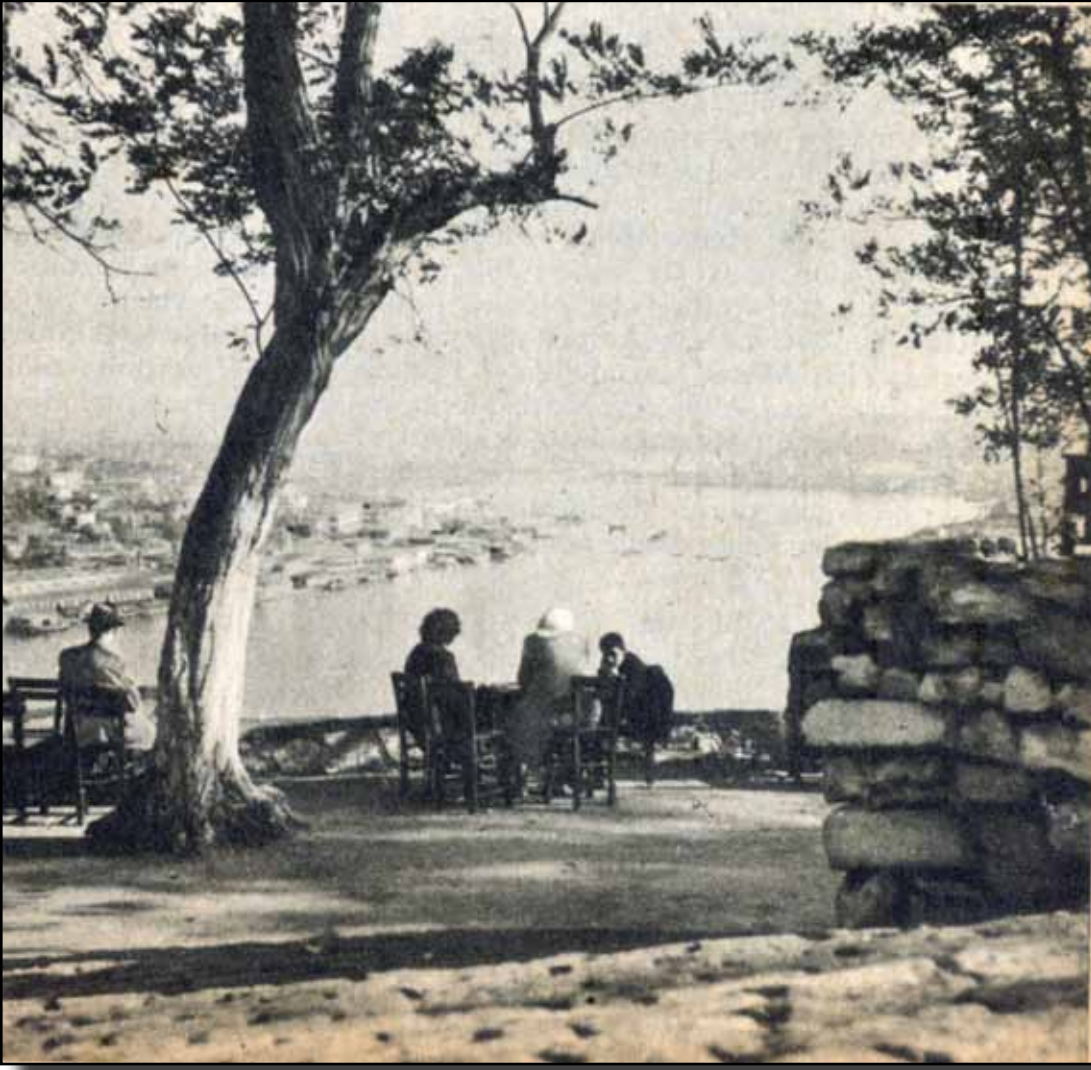
Piyer Loti kahvesinden Haliç'in eski bir manzarası.

liç, Edebiyat-ı Cedîde'siz kalacaktı. Fakat sonradan öğrenildi ki, bu ev İstanbul'da, Zincirlikuyu'da, Balat'ın üstünde imiş.