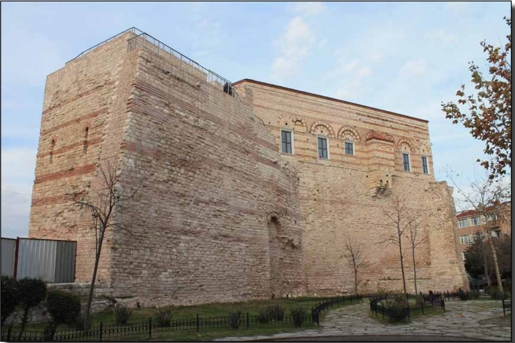
Konstantin Porfiroyenet (Konstantinos Porphyrogennetos) Sarayı (Tekfur Sarayı) yandan görünüşü.

zaman içerisinde yağmurdan ıslanıp dondan çatlayarak parçalar halinde düşüp adeta yontulmuş gibi olmuşlardır. Müze-i Hümayun tarafından bu sütunların tuttuğu kemerler ahşap duvarlarla sağlamlaştırıldığı gibi bu çok değerli yapının tümüyle harap olmaması için de önemli girişimlerde bulunmaktadır.