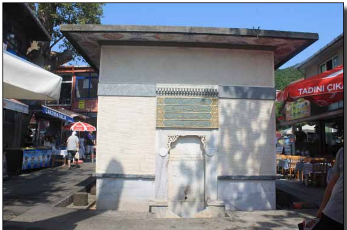
Anadolu Kavağı Hasan Paşa Çeşmesi.