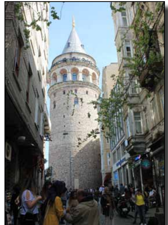
Büyük Hendek caddesinden Galata Kulesi.

Galata Kulesi (Beyoğlu): Bu kaleye (Castrum Sanetoe Crucis), (Chastel de Pere) yani Mukaddes Haç Kalesi veya Galata Kalesi diye adlandırılıyordu. Fetihden sonra Galata Kulesi ile beraber bu kalenin de yıkıldığı bazı eserlerde bahsediliyorsa da bu hususta çeşitli rivayetler bulunmaktadır. Özellikle burasının barut mahzeni olarak kullanıldığı ve bir gün patlayarak harap olduğu da herkes tarafından anlatılır. Skarlatos Bizantiyos bu kaleye "Manganon" diyor. Manganon kelimesi savaşta kullanılacak alet ve malzemelerin muhafazası için özel bir yer anlamına geldiğine göre bu tabir rivayete de uygun düşüyor. Arapça Kal'a kelimesinin zamanla bozulmasından Galata'ya dönüştüğü sanılmaktadır. Galata Kulesi, Doğu Roma İmparatorlarından [Flavius Anastasius Augustus (I. Anastasius Dico-