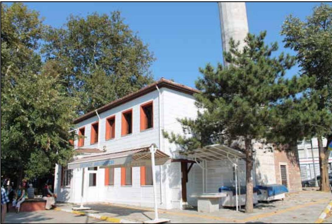
Kanlıca Gazi İskender Paşa Camisi

Yedi iklimin hükümdar hazretleri Alemin dayanağı, adalet köşkünün sultanı Yani Sultan Üçüncü Ahmed Yardımcı olsun ona dört taraf Öyle bir gazi padişah ki Bayezit ondan hak yolunda gitmesini ister Bu çağırmalar oldu hükümdarlığının makamı Meleklerle zamlı dualar Bir vezire onu muaffak etti Kullarından cömertliğini esirgemiyen Allah'ım Merhametli, cömert tabiyatlı Eli açık, ileri görüşlü Büyük sihirle Alemde tek İlim kaynağı, vakur, doğruluğu ispatlan-