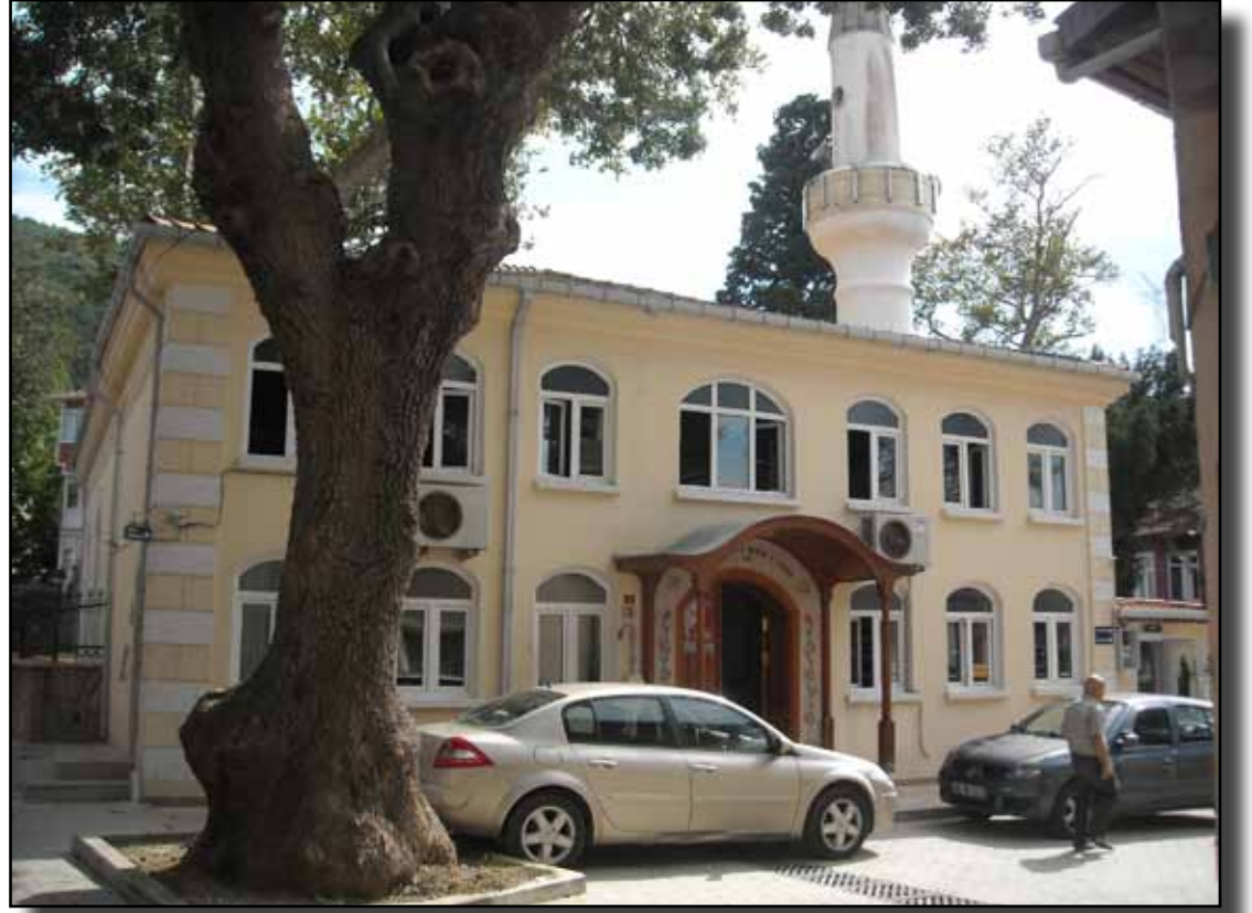
Anadolu Kavağı camisi.