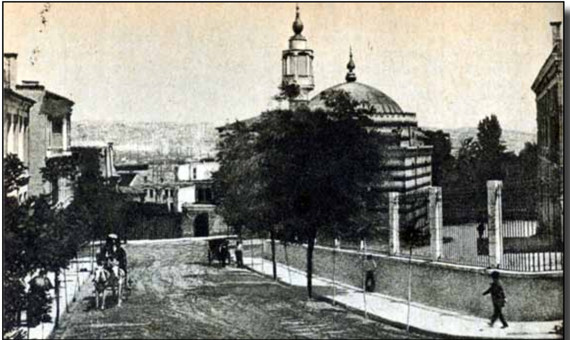
Eskiden bazı edebiyatçıların oturduğu Babiali'ye ait eski bir fotoğraf.