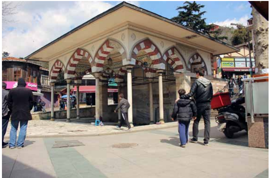
Beykoz İshak Ağa çeşmesi.

Ne ayağı ne başı ne âhiri ne evveli Bulamazdı gözlerin ayn-ı hayât-âsâ eğer Olsa İskender elinde âfitâbin meşali Az kalmışdı ki nâmın Kuru Çeşme koyalar Bir musavver kubbeli bir kaç mücessem lûleli Hak ta'âlâ pâdişâhın ömrün efzûn eyleyüb Düşmanın her kanda varsa eylesin müstesâlî Himmet ile eyledi evvelkiden a'lâ binâ Mühmeli oldı mükemmel hem mufassal mücmeli Şöyle ra'nâ yapdı kim gözler nazîrin görmedi Asiyâb-ı tünd-çarh-ı âsumân devr edeli Mâ-i berdi şöyle kim eyyâm-ı tâbistânda Beykoz ehli gâlibâ der-pîş ederler mankali Çeşme-i hayvan idi gûyâ zılâm-ı hâkde Buldı Hızr-ı himmetiyle ânı Mahmûd