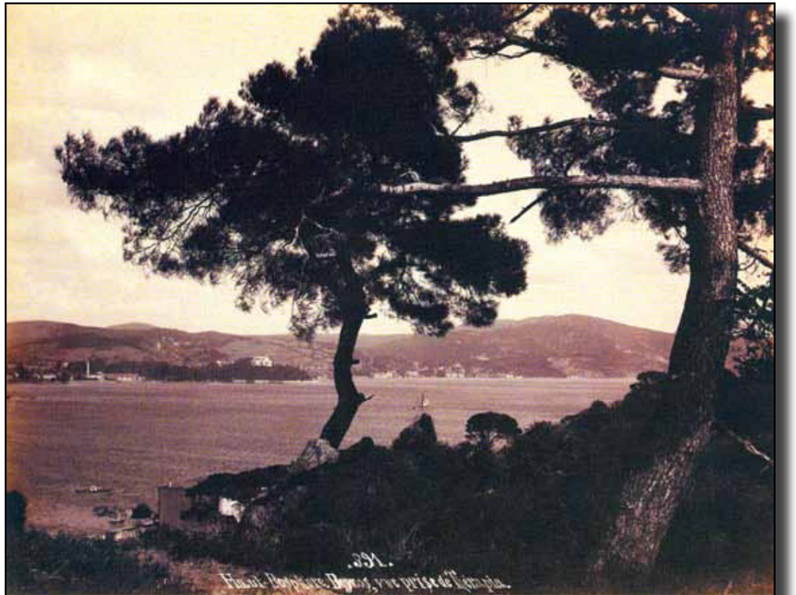
Bogaziçi'nden bir görünüm.

Engaripadressesahibi olan yazar, Cenab Şehâbeddin'dir. Edebiyat-ı Cedide'nin bu tanınmış şairi, Meşrutiyet'in başlarında Balat'ta oturuyordu. Eğer uzun bir kartviziti üzerinde bu adresi görlerdi Ha-