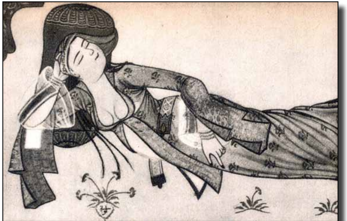
Ortaçağ'da yapılmış bir gravür.

Şökli Melik, Burla Hatun'u saki yapmak ister. Fakat Burla Hatun'u korumak için esirlerin hepsi de Burla Hatun'un kendisi olduğunu söylediğinden, kırk ince belli kızdan hangisinin hakikî Burla Hatun olduğu tespit edilemez. Sonunda Şökli Melik korkunç bir usule baş vurur: Urus'un etinden yemek yapılarak onlara verecek. Kim yemezse, onun Burla Ha-