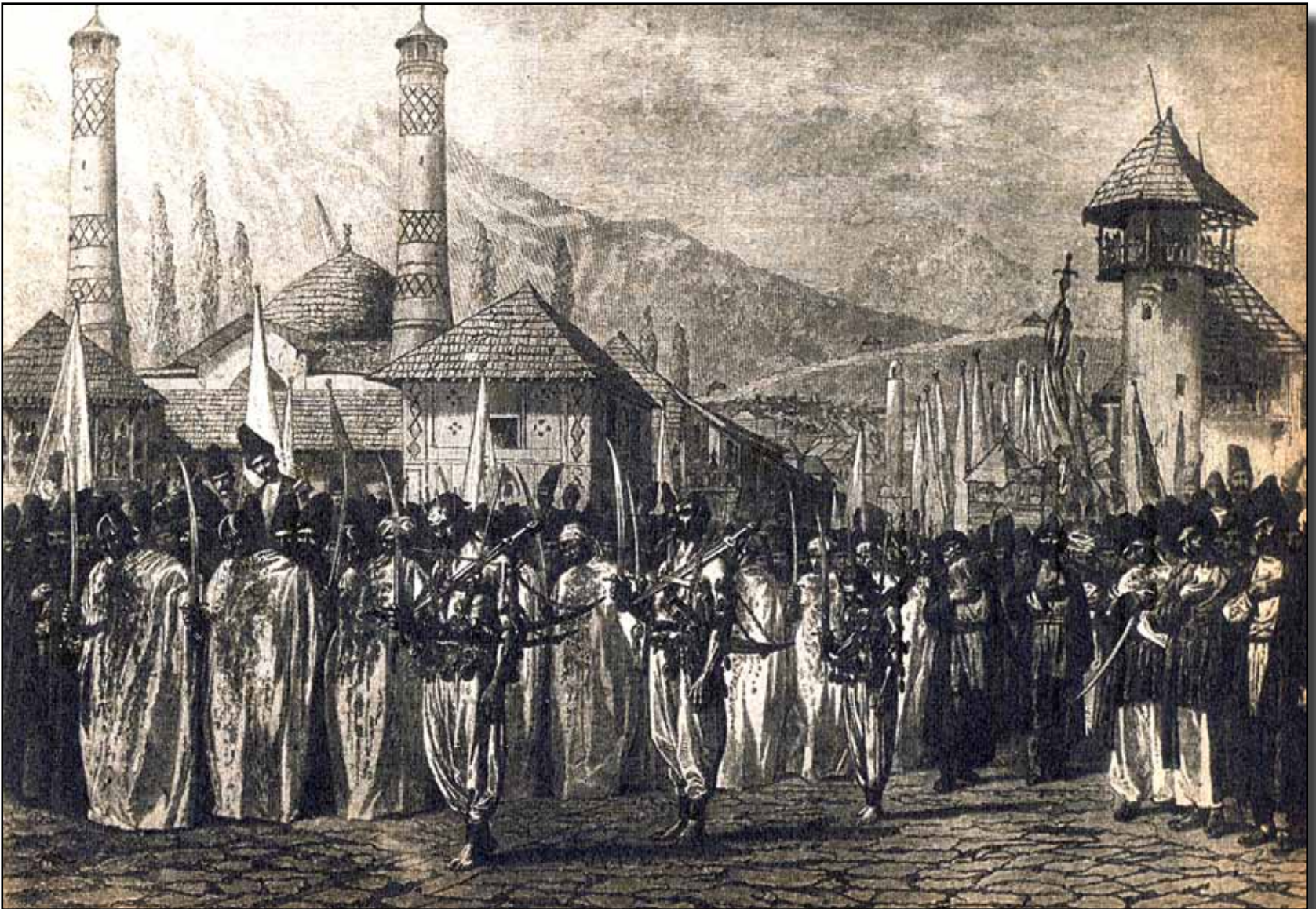
Şuşa'da Muharrem ayında yapılan matem ayininden bir görünüm.