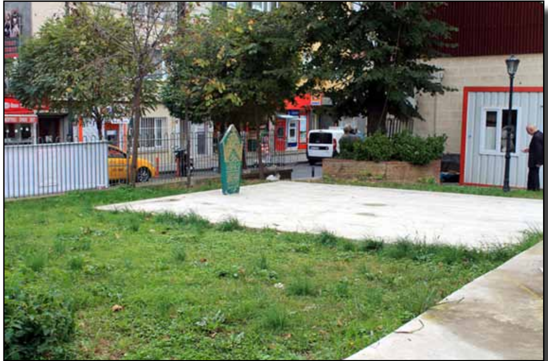
Eskiden Çiçekçiler Kahvesi'nin bulunduğu yer ve önünde Ayşe Ofha İfkfnwforç

Ceneviz Kalesi (Anadolu Kavağı): Yûşa Dağı ve Anadolu Kavağı'nın kuzeyinde ve Kavağın üstünde Ceneviz Kalesi adı ile bilinen eski bir kale bulunur. Bu kale Boğaz'ın Karadeniz kısmı ile Büyükdere önlerine hâkim bir yerde çok sağlam bir korunaktır. Eski adı [Yoros]'dur. Kavak yakınında olan bu yerde Sultan Bayezit tarafından zeminden yüksek olarak olarak bir mescit yapılmıştır. Eskiden kale içerisinde bir çeş-